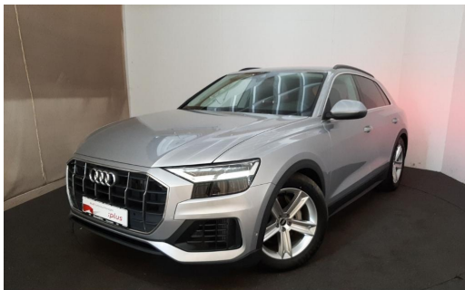
Osenstätter gut ankommen... Audi Gebrauchtwagen plus